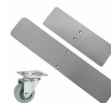
Platte voeten met of zonder wielen